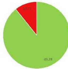
Volksabstimmungsergebnis in Rohrbach Wahlbeteiligung 59,91 %